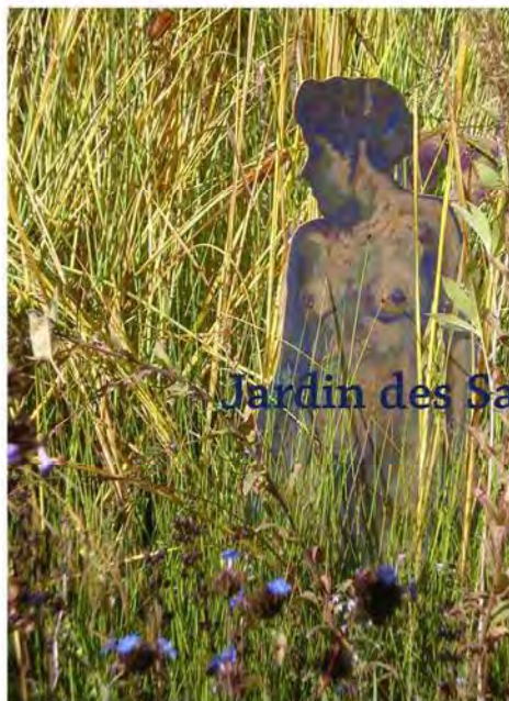
Jardin des Sambucs